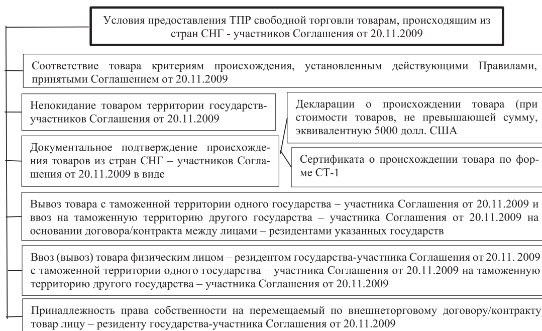
Рис. 1. Условия предоставления тарифно-преференциального режима свободной торговли товарам, происходящим из стран СНГ – участников Соглашения от 20.11.2009