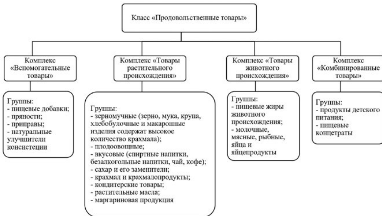
Рис. 1. Классификация продовольственных товаров